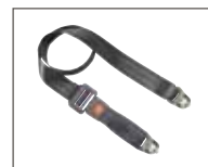
Cintura bacino con bloccaggio**