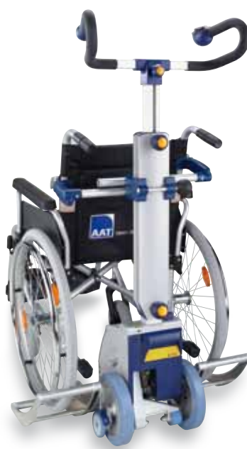
SDM7 supporto universale per carrozzine e passeggini

Per coloro che hanno bisogno di un aiuto solamente sulle scale e, il particolare, quando queste sono molto strette o a chiocciola, il montascale mod. s-max sella con seggiolino è la soluzione ottimale. La pedana è regolabile in altezza e ribaltabile all'indietro. In caso di trasporto o inutilizzo, il seggiolino può essere richiuso.