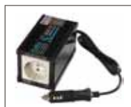
Invertitore di corrente