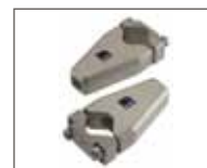
Supporti ruote estraibili