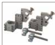
Dispositivo di aggancio