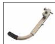
Leva per reclinazione