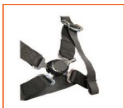
Cintura pettorale a 4 punti