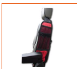
Sacca portaoggetti laterale