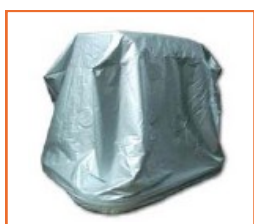
Telo di copertura laterale