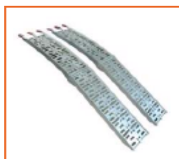
Rampe in alluminio pieghevoli