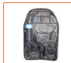
Sacca portaoggetti posteriore